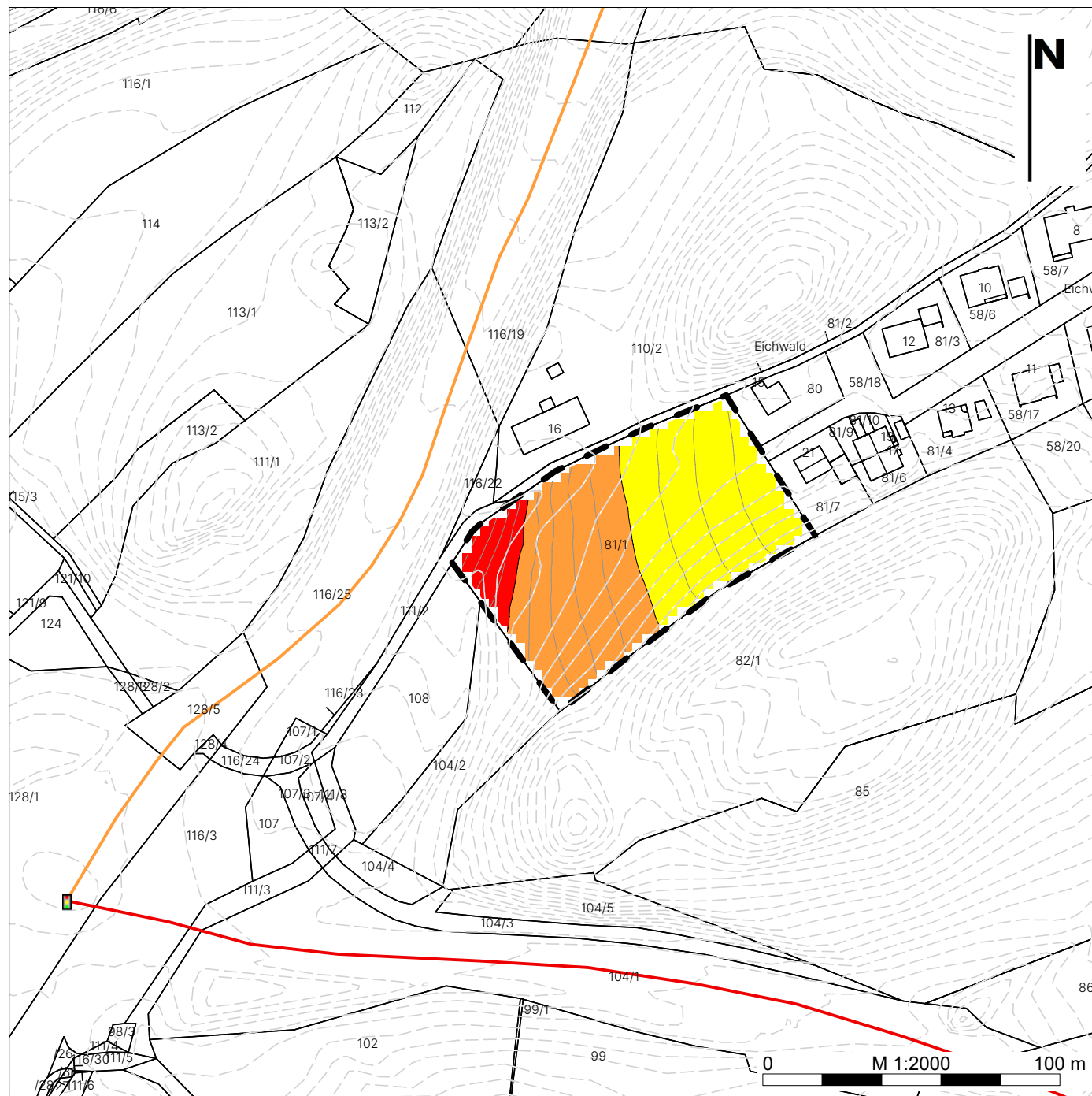
Tagzeitraum (6:00 bis 22:00 Uhr)